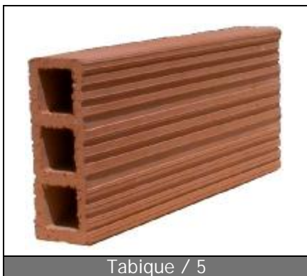
Tabique / 5