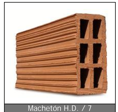
Machetón H.D. / 7